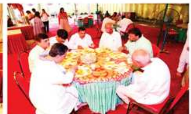
પ્રાસાદને ન્યાય આપતા મોતા પરિવારના ભાવિકજનો