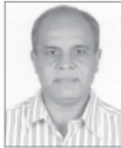
શ્રી અતુલ ડુંગરશી ધરમશી અજ્ઞાનચી