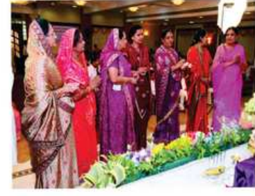
શાળ ધરાવવા પધારતા લાભાર્થી પરિવાર